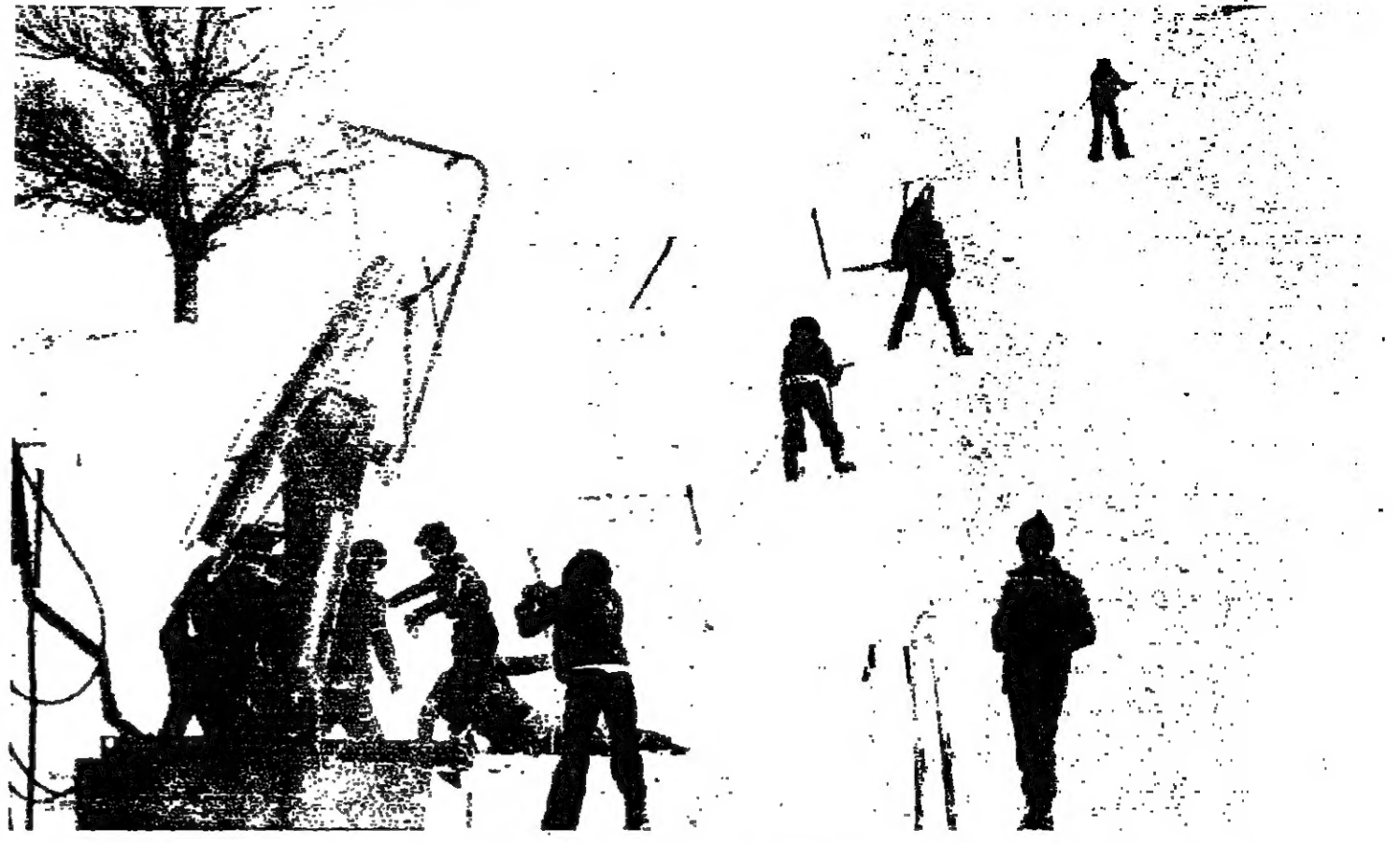
رحلة الصعود تهيأ للمصودة زلجا

كتب مروان عبدالله : بين فاريا وفترا توزع هواة الثلج امس بكثافة وفرح الاطفال الذين سئوا شوارعهم المختصرة ، والكبار الذين هجروا الى حيث لا مدينة ولا اختصار مسافات وانسان . داليدا كانت تغني امس «اضحك فانت الملك» . عمروا التسابل تحت الشمس وكتبوا باصابعهم بعض قصص حب او رستوا الشجر العماري والمعاصف التي لم تات امس الى مدينة الثلج . المهم انهم هناك يختصرون احزانهم ويحاولون الفرح ويستقرون بعض الغيم الطالع . وحده الانسان على حقيقته ، هندسة الاشكال تسقط ، ومن طبيعة آدم لم يبق الا هذا الشجر الذي يتراخي من بعيد ، وهذه الطرق التي تتسلل بين كوم الثلج وتضيق حيث تضيق مخلقة وراها بعض خطوط سوداء احلى ما فيها حياؤها المرتجل . « اضحك فانت الملك » . سكان الثلج امس مارسوا لعبة الملك وتذوقوا بعضهم بكرات الثلج . المخار يفقهون عندما تطال تذايقهم الكبار . على كل حال ، انها لعبة الملك . ورقصوا حتى الفرح ، زرعوا صدر الجبل خطوطا متشابكة كالمسام ، قرأوا وطمعوا مرات ومرات . حفروا لانفسهم ظللا تخاف القبة . المهم ان الحرب انتهت ، والسلام ات ولو على عربة يقودها طفل صغير وهم الان يعيشون فرح السلام ونعمة الثلج في وطن الثلج . القيم مر من تحت الجبل والمدينة في الفاع وهم على القبة . بينهم وبين المدينة والمضيق تلال من الغيم . والاستراحة كانت في فندق « فاريا الزار » .